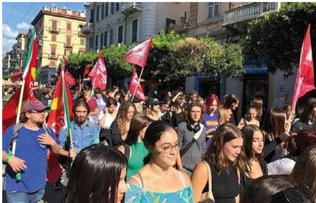
foto: z protestnej akcie za účasti Federazione Giovanile Comunista Italiana (Facebook)

aký zjavný nezáujem západné krajiny majú v ukončenie vojny (ktorá sa už vyostriala do čistého proxy konfliktu medzi NATO a Ruskom) prostredníctvom politických nástrojov, čo vedie nielen k masakru ľudí v zasiahnutých krajinách, ale aj k sťaženi už katastrofálnych ekonomických podmienok ľudu v ostatných štátoch. Nehorázný rast v cenách energií a základných potravín a zhoršujúca sa inflácia (zvyčajne spôsobená cynickými špekuláciami zopár kapitalistov v snahe zvyšovať svoje zisky) sú iba očividnými následkami, ktoré prežívame. Snáď ešte nebezpečnejším následkom, ktorého sme svedkom je rozmach militarizmu. Každú chvíľu počúvame