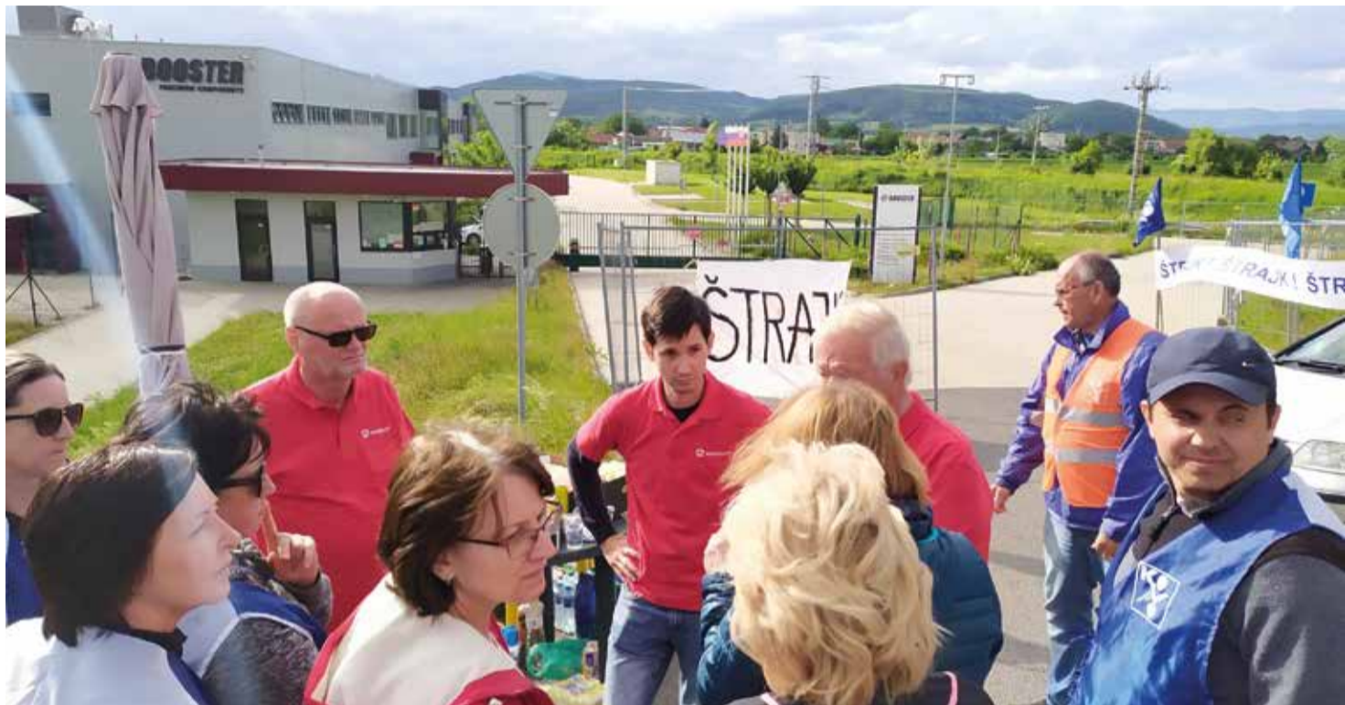
Predstavitelia hnutia Socialisti.sk na štrajku zamestnanectva BPC Beluša v roku 2021

Lepšie Slovensko je možné - Slovensko mierové, sociálne, ekologické. Dosť bolo oligarchov, privatizérov, špekulantov, vlády (cudzieho) kapitálu! Chceme, aby sa na Slovensku žilo dôstojne a dobre. Všetkým.